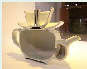
계영배 단면

우리나라에서는 조선시대 큰 명성을 얻은 도공 우명옥이 자신의 방탕한 과거를 뉘우치면서 자만함과 가득참을警戒하는 "계영배"라는 잔을 만들었다고 하며,