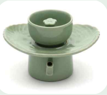
계영배(戒盈杯) 戒 警戒할 계 盈 찰 영 杯 잔 배 "가득참을警戒하는 잔"

과음을警戒하기 위해 만든 잔으로, '절주배(節酒杯)'라고도 하는 계영배는 술이 일정 이상 차오르면 그 술이 모두 밑으로 새어나가도록 만들어져 있습니다.