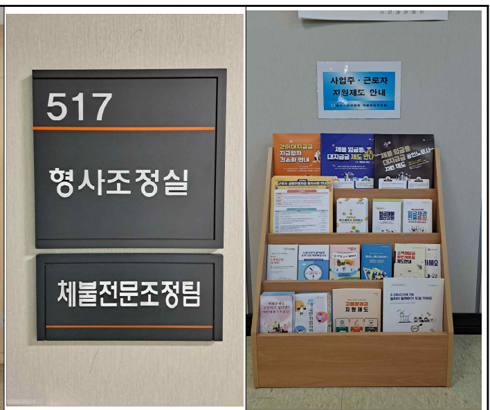
유관기관 통합 안내자료 배치