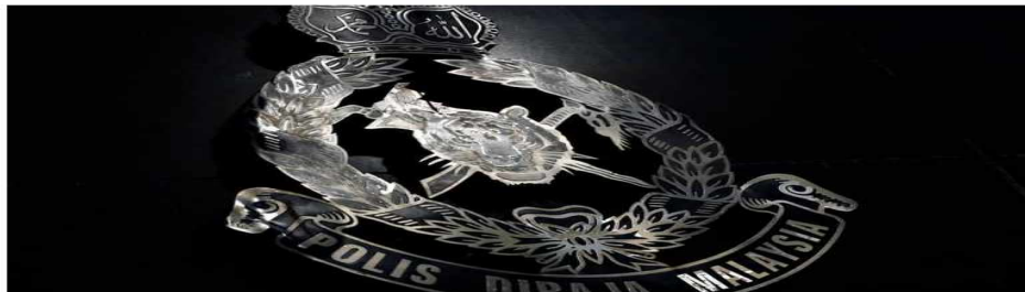
Pix for representational purpose only.