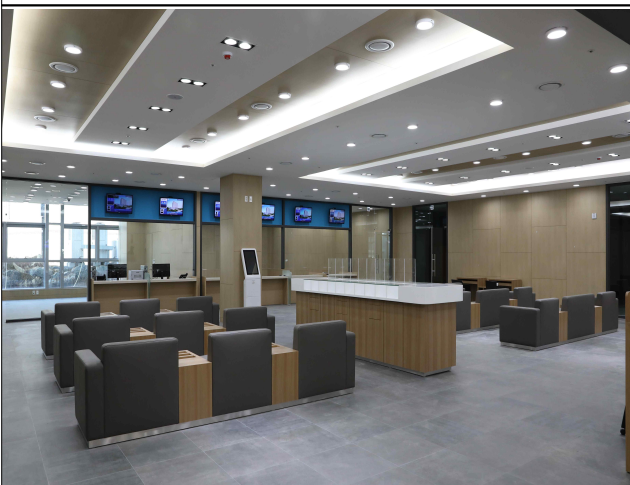
1층 민원실 내부