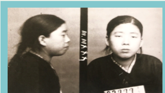
수형기록표 속 이명희 지사의 사진 출처 : '서대문형무소 역사관' 책자

독립운동가 집안에서 태어난 이명희 지사는 10살 무렵 아버지가 일제에 잡혀가는 것을 목격한 순간부터 독립운동에 뜻을 두게 되었고,