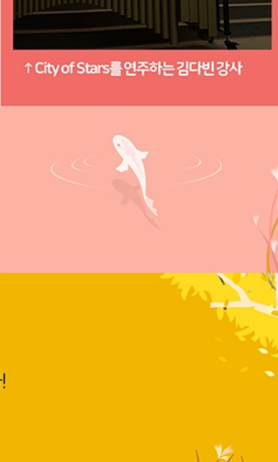
↑ 하트하트 오케스트라의 연주

이렇듯 꾸준히 뜻 깊은 인권문화제를 진행하고 있는 대검찰청 인권부는 앞으로도 장애인 위해 외국인 등 사회적 약자 보호와 검찰 구성원의 인권 감수성 증진을 위한 다양한 교육프로그램을 개발하는 등 노력할 것"이라고 밝혔습니다. 인권 보리를 위한 검찰의 노력, 계속 응원하고 지켜봐 주세요~