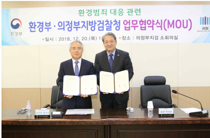
[첨부 : 업무협약식 사진]