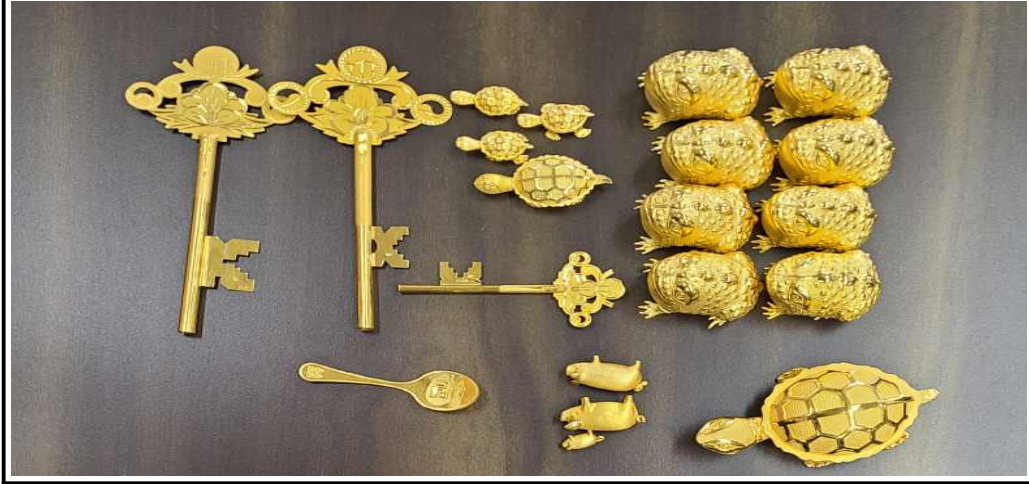
甲으로부터 압류하여 공매한 금붙이 사진