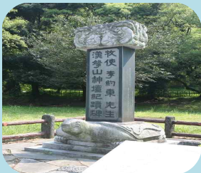
한라산 정상에서 올리던 산신제로 인해 백성들이 얼어죽는 등 고통이 이어지자 이약동 목사가 한라산 초입으로 제단을 옮겨 만든 산천단. 위 사진은 산천단에 있는 [이약동 목사의 공덕비]

그 후 말채찍은 목사가 정사를 다스리는 곳에 걸려 후임 목사들이 그의 선정을 본받을 수 있게 하였으며, 후손들은 말채찍이 다 닳아서 사용할 수 없게 되자 그림으로 벽에 그려두어 그를 기억했다고 합니다.